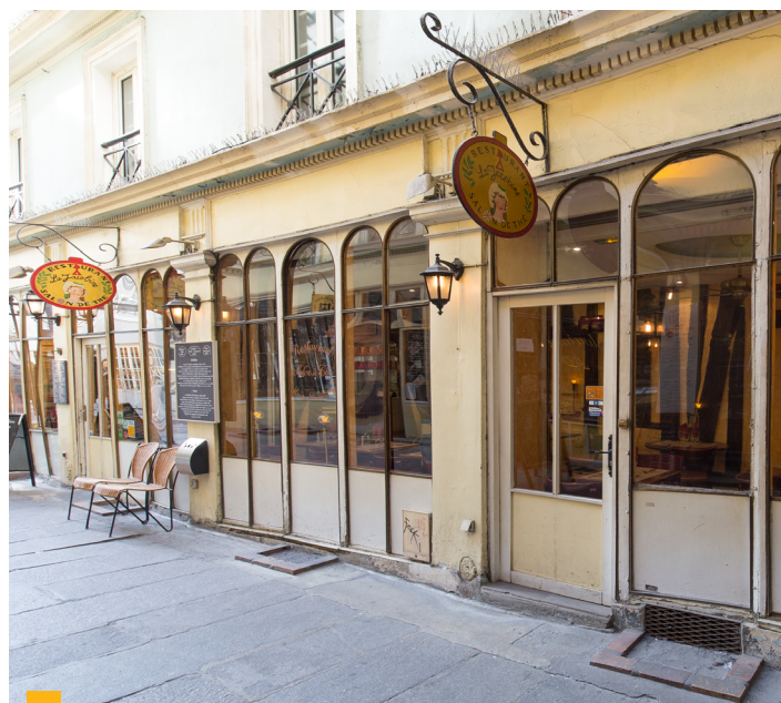
59-61, passage Saint-André des Arts - Paris 6 ème

En 2019, votre SCPI continue sa politique d'arbitrage active afin de redynamiser son patrimoine.