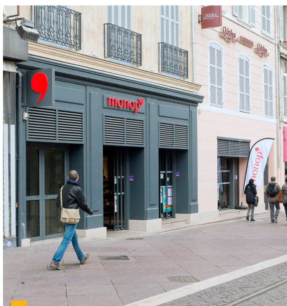
134-138, La Canebière à Marseille 1 er